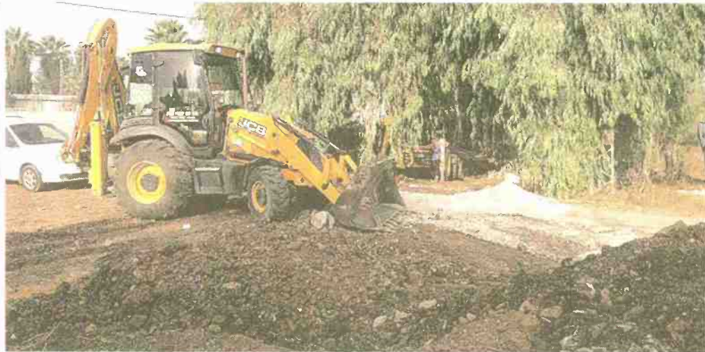
עבודות התשתית ומתבצעות במלוא המרץ